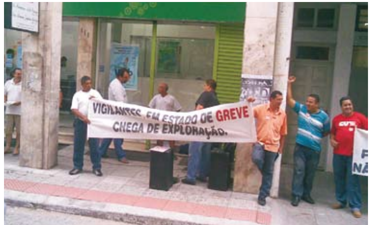
Luta por reajuste salarial promoveu estado de greve em fevereiro de 2009 e conseguiu avanços importantes no dissídio da categoria