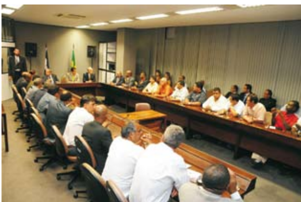
Categoria esteve reunida com o Ministro do Trabalho Carlos Lupi para discutir a atuação de fiscalização das empresas clandestinas