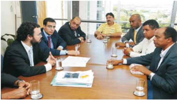
Reunião no Ministério da Justiça em Brasília para protestar contra o uso de malotes de tinta que causam desemprego