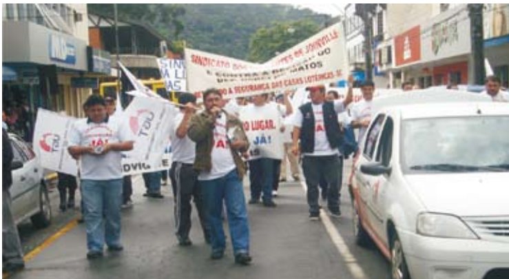
Em Joinville foi feita uma passeata para defender as medidas de segurança com contratação de vigilantes nas casas lotéricas