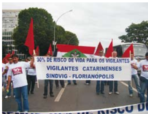
Vigilantes catarinenses participaram da marcha em defesa do adicional de periculosidade