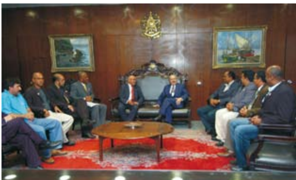
O Projeto do Adicional de periculosidade de 30% foi discutido em várias reuniões em Brasília, como esta com o presidente do Senado, José Sarney