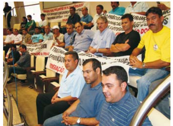
Participação do Sindvig/Fpolis na votação do Projeto que prevê a obrigatoriedade de vigilantes nas casas lotéricas e nas agências de correio